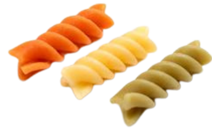
Tricolore Fusilli A2