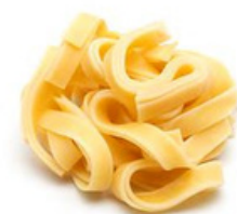
Tagliatelle XL A10-XL