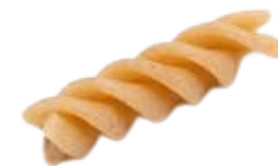
Fusilli Whole wheat A17-10