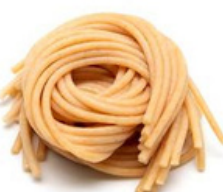
Spaghetti Whole wheat A15-VK