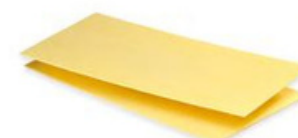
Lasagna Sheets A22 100% cooked Format: 1/1 GN

Osäker på exakt mängd pasta du behöver idag? Med vår 'al dente' förkokta långa pasta, individuellt fryst i praktiska 50g nästen, är denna osäkerhet inte längre ett problem. Från fryst tillstånd kan du enkelt förbereda en enskild portion i en pastakokare eller värma upp en större mängd med ånga i en ugn.